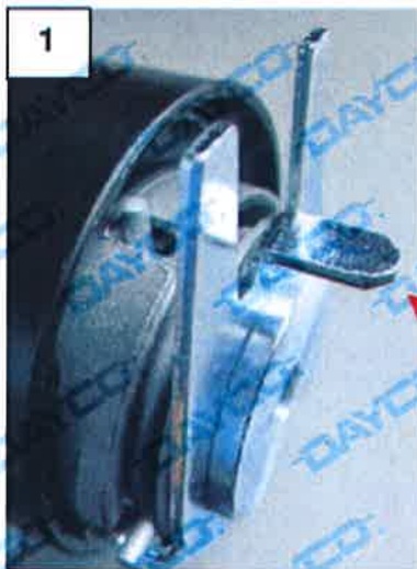
ALETTA DI FERMO